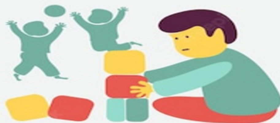
Preferred to play alone